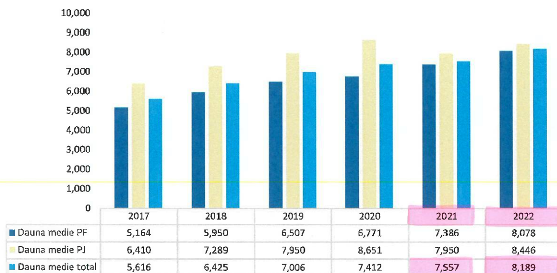
Grafic 37 Evoluția daunei medii plătite pentru RCA - daune materiale (lei)

*Notă: sunt incluse doar societățile autorizate și reglementate de ASF